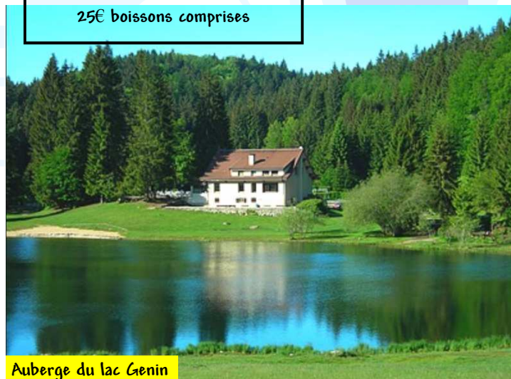
Auberge du lac Genin